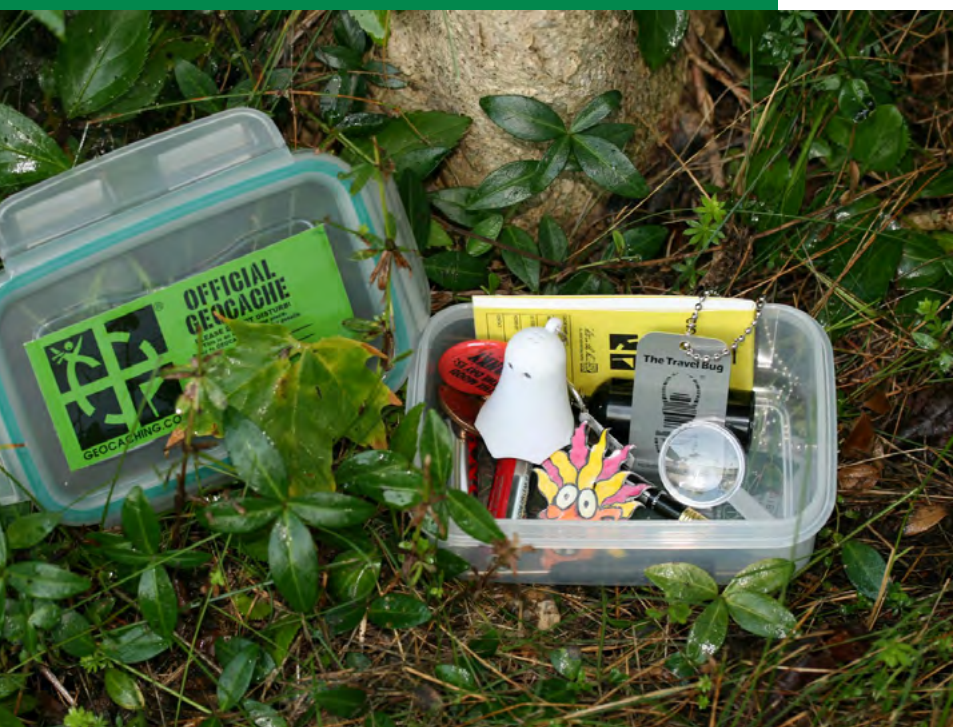
Boîte hermétique contenant le logbook, le crayon, le mot de bienvenue, les badges et la légende

Une personne responsable sera désignée pour entretenir la cache : l'enseignant (et ses élèves). L'idéal est de vérifier la cache physiquement et via le site de géocaching (si la cache est détériorée, certains géocacheurs le signalent).