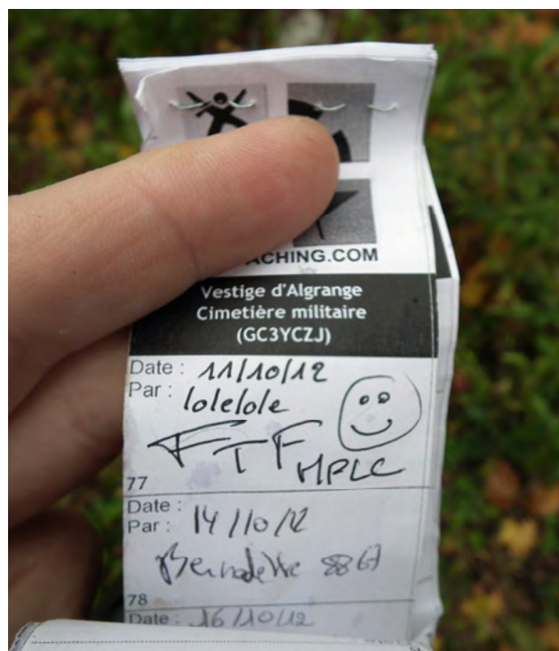
Logbook reprenant la date et le nom du visiteur